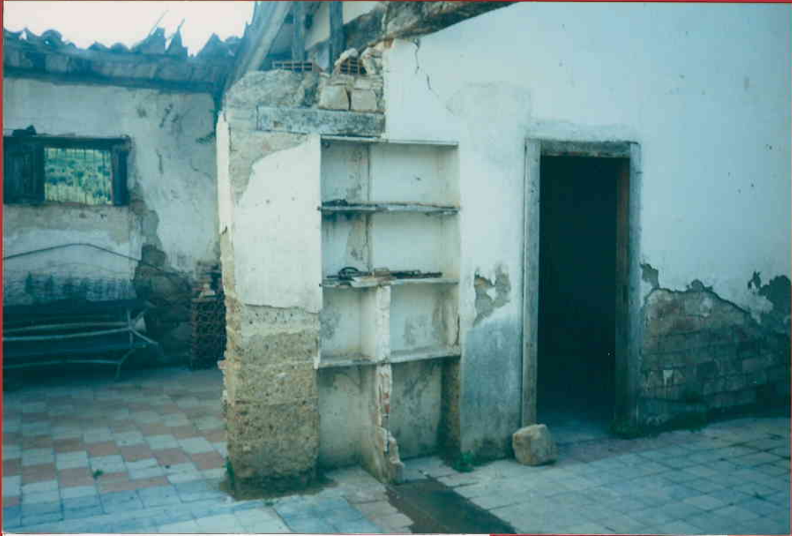
ZONA INTERNA DEL FABBRICATO