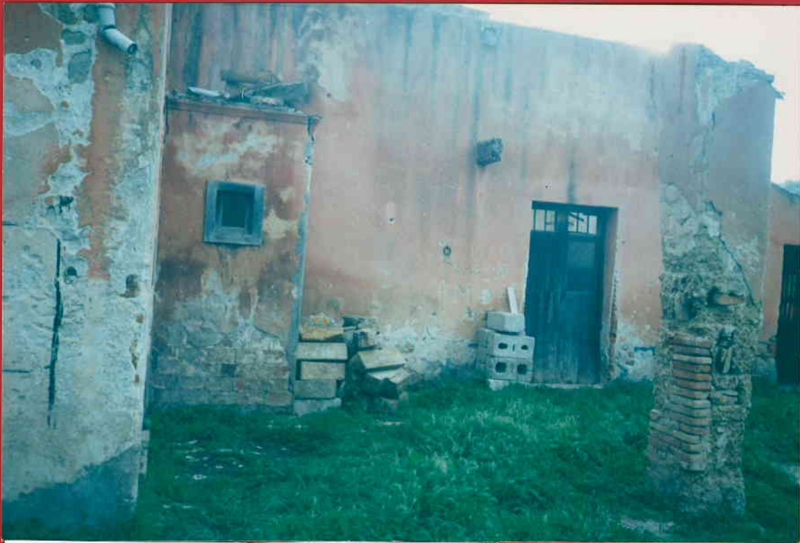
PORTA D'ENTRATA PRINCIPALE