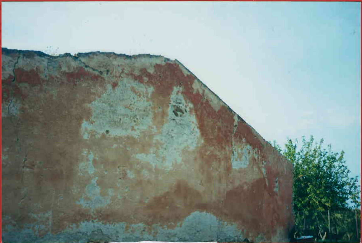
PROSPETTO ANTERIORE DESTRO