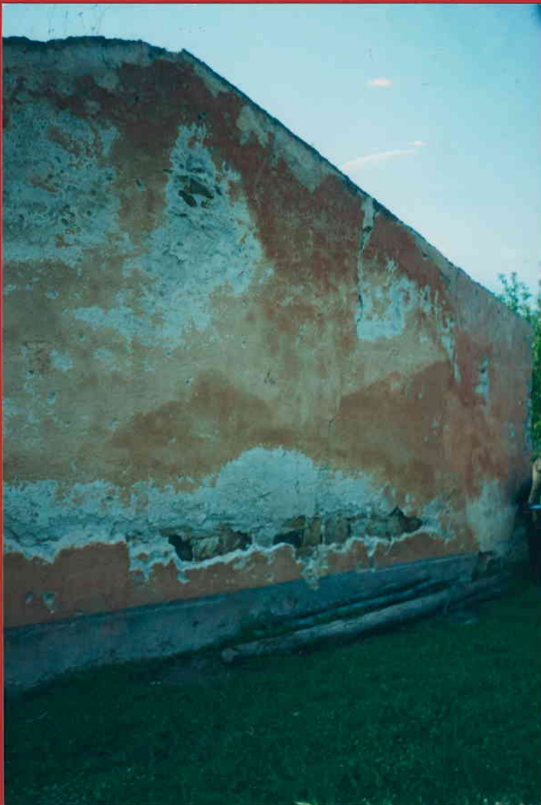
PROSPETTO ANTERIORE DESTRO