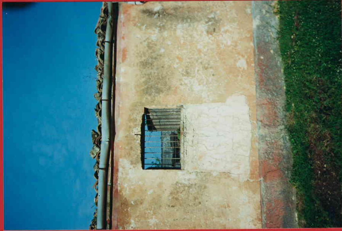
FINESTRA POSTERIORE SINISTRA