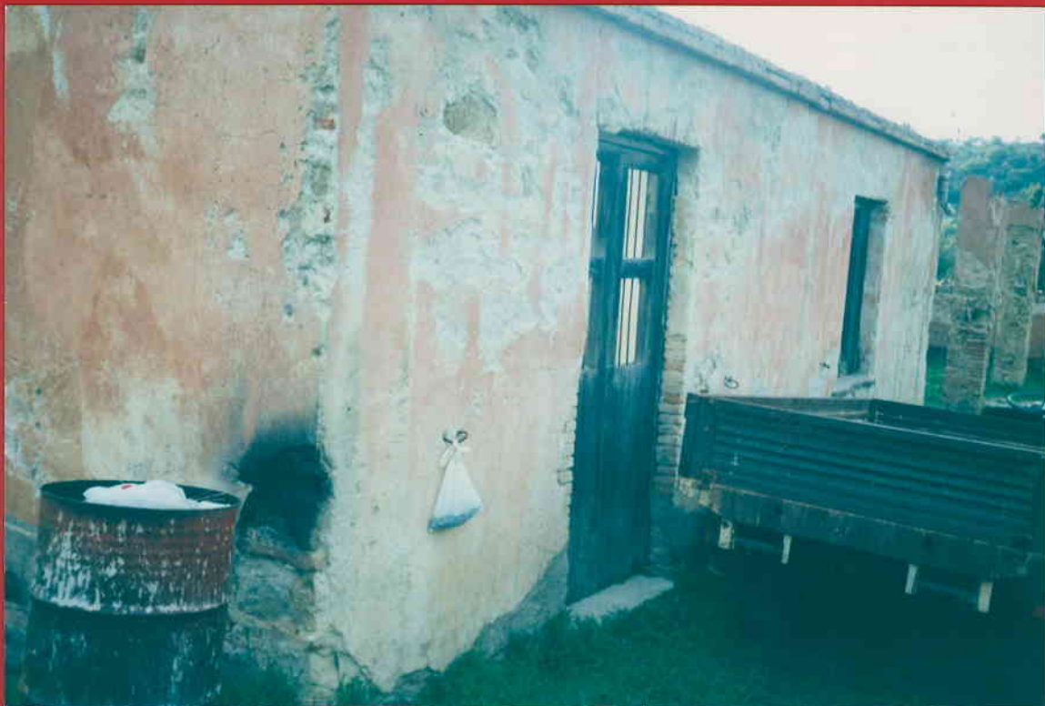
PROSPETTO ANTERIORE SINISTRO