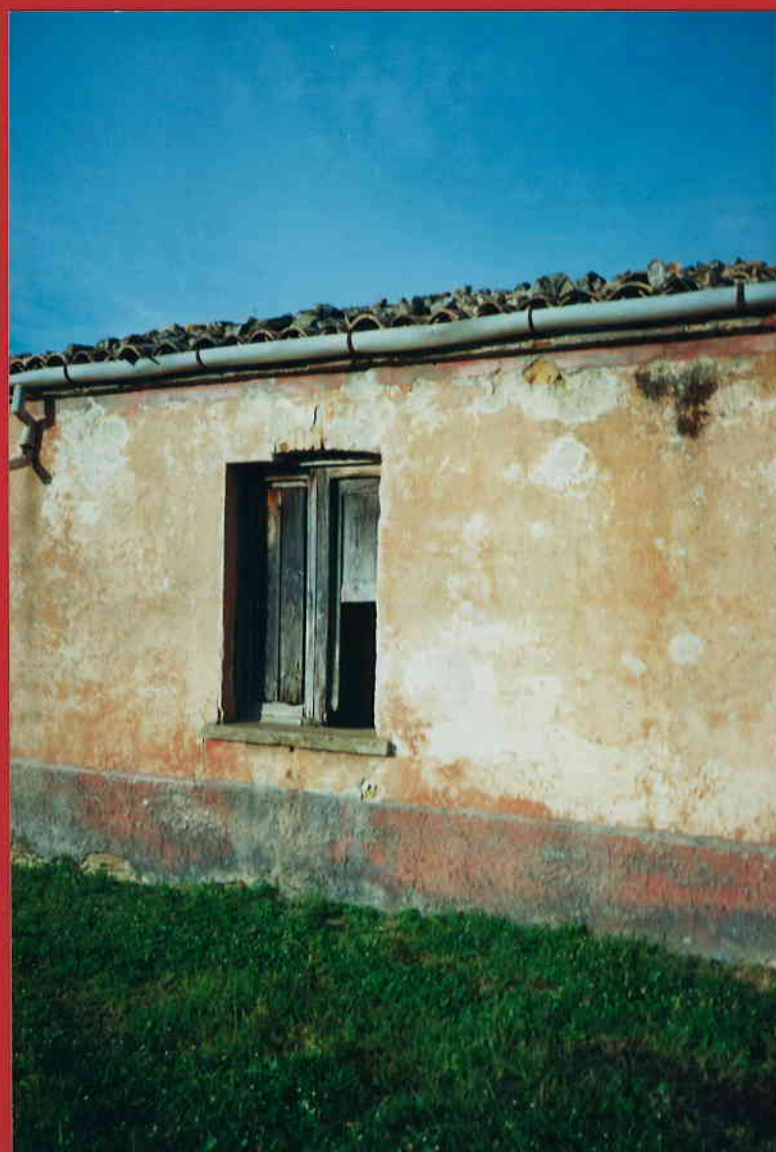
FINESTRA POSTERIORE DESTRA